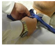
仏衣一式・旅支度