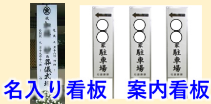
名入り看板 案内看板