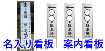
名入り看板 案内看板